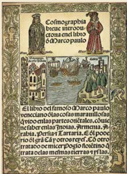
Libro de las Maravillas del Mundo, de Marco Polo, edición española del año 1503.

Al relatar sobre las tierras vistas, Marco Polo describía para sus contemporáneos europeos varias preferencias culinarias de los habitantes del Oriente.