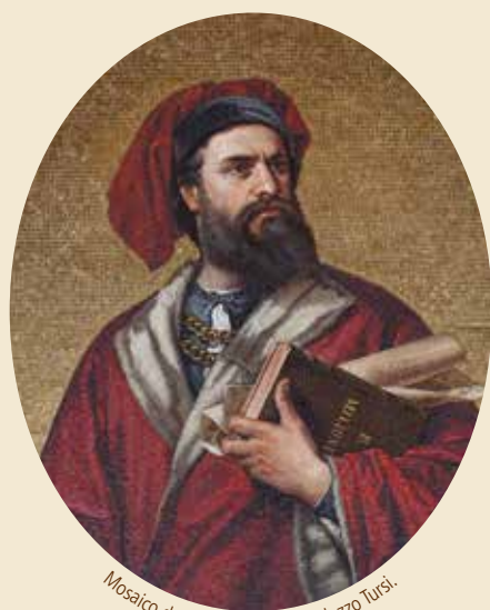
Mosaico de Marco Polo en el Palazzo Tursi.

N ació el 15 de septiembre de 1254 en Venecia, República de Venecia actual Italia, 1254-id., 1324) explorador y mercader veneciano.